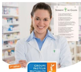
Appel à candidature Prix de thèse

Le Groupe Pasteur Mutualité et GPM Pharmaciens, en partenariat avec la FNSIP-BM, lancent un appel à candidature pour l'attribution de prix de thèse visant à récompenser les internes ou diplômés des filières Pharmacie , Biologie ou IPR . 3 prix d'une valeur de 2 000 € chacun seront remis au lauréat de chaque spécialité. Les dossiers de candidature sont à déposer avant le 31 juillet et peuvent être téléchargés sur le site www.gpm.fr